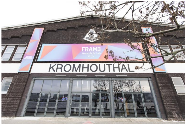
Frame Lab: Im Kromhouthal in Amsterdam gab es für Besucher und Design- und Architektur-Experten spannende Einblicke in die Welt der Arbeit von Morgen.