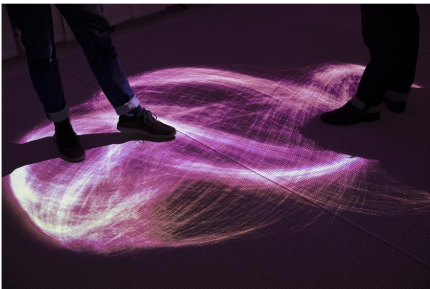
Licht folgt Bewegung: Aussteller zeigten, wie Menschen mit Räumen interagieren können. Die Bodenbeleuchtung reagiert auf menschliche Bewegungen und wird so zum Kommunikationsmedium.